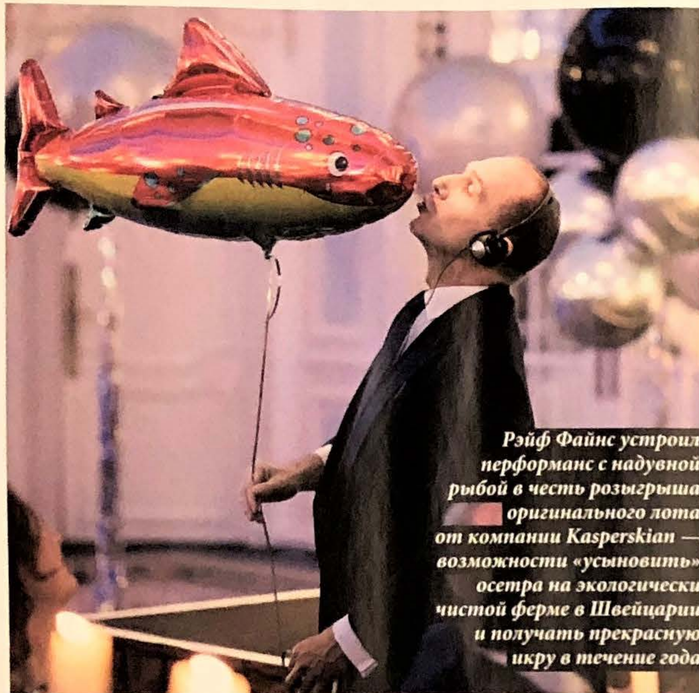
Рэйф Файнс устроил перформанс с надувной рыбой в честь розыгрыша оригинального лота от компании Kasperskian — возможности «усыновить» осетра на экологически чистой ферме в Швейцарии и получить прекрасную икру в течение года

«БЕЗ ПОДДЕРЖКИ ФОНДА СОТНИ ДЕТЕЙ И ИХ СЕМЬИ БЫЛИ ВЫНУЖДЕНЫ СПРАВЛЯТЬСЯ С БОЛЕЗНЬЮ В ОДИНОЧЕСТВЕ» /РЭЙФ ФАЙНС/