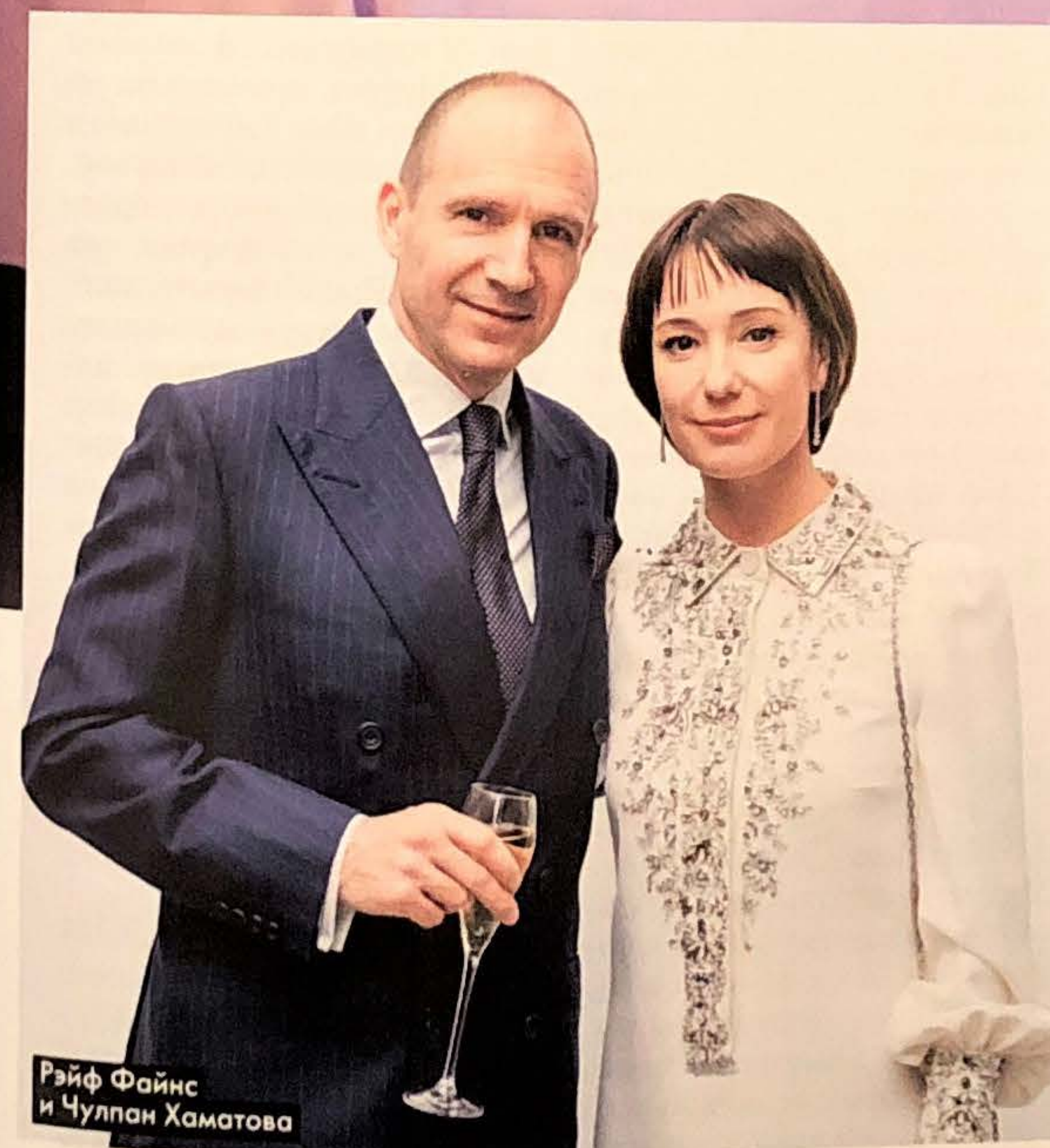
Рэйф Файнс и Чулпан Хаматова

В РАМКАХ ВЕЧЕРА ПРОВОДИТСЯ АУКЦИОН. НА ФОТО — ЛОТЫ ЭТОГО ГОДА: БИЛЕТЫ НА ЛУЧШИЕ КУЛЬТУРНЫЕ МЕРОПРИЯТИЯ 2018-ГО, ГРАВЮРЫ, АРХИВНЫЕ ФОТОГРАФИИ, СЕРТИФИКАТЫ НА ПУТЕШЕСТВИЯ