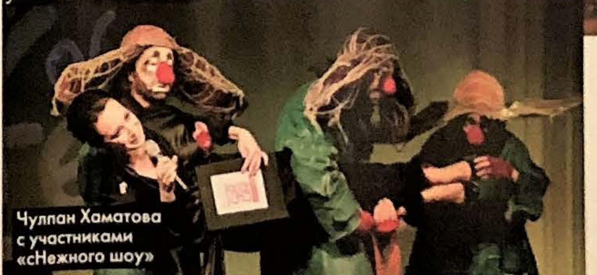
Чулпан Хаматова с участниками «Снежного шоу»