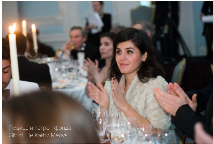
Певца и патрон фонда Gift of Life Кэйти Мелуа

13 ЯНВАРЯ ФОНД GIFT OF LIFE ПРОВЕЛ ПЯТЫЙ ЮБИЛЕЙНЫЙ БЛАГОТВОРИТЕЛЬНЫЙ ВЕЧЕР В ПОЛЬЗУ ПОДОПЕЧНЫХ РОССИЙСКОГО ФОНДА «ПОДАРИ ЖИЗНЬ» В ОТЕЛЕ «САВОЙ» В ЛОНДОНЕ. НА ВЕЧЕРЕ БЫЛО СОБРАНО БОЛЕЕ 400 000 ФУНТОВ В ПОМОЩЬ ДЕТЯМ С ОНКОЛОГИЧЕСКИМИ И ГЕМАТОЛОГИЧЕСКИМИ ЗАБОЛЕВАНИЯМИ.