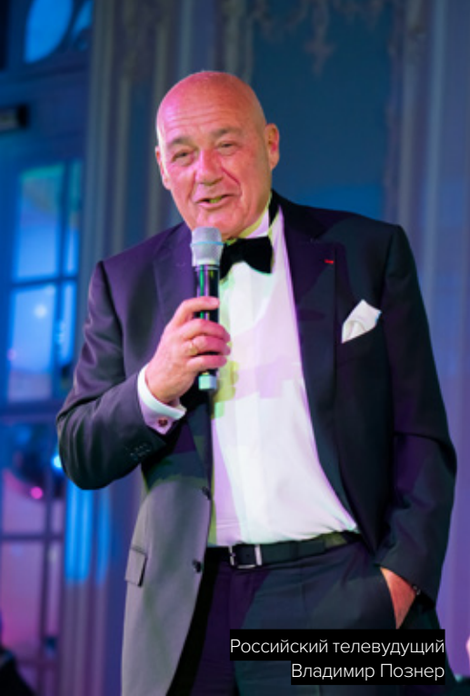
Российский телеведущий Владимир Познер