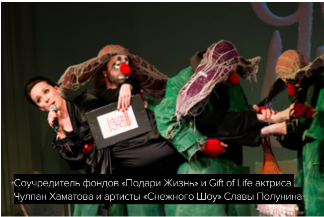
Соучредитель фондов «Подари Жизнь» и Gift of Life актриса Чулпан Хаматова и артисты «Снежного Шоу» Славы Полунина