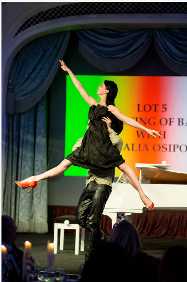
Артисты балета Наталья Осипова и Сергей Полунин