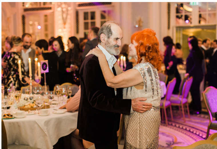
Художник Эрик Булатов с супругой