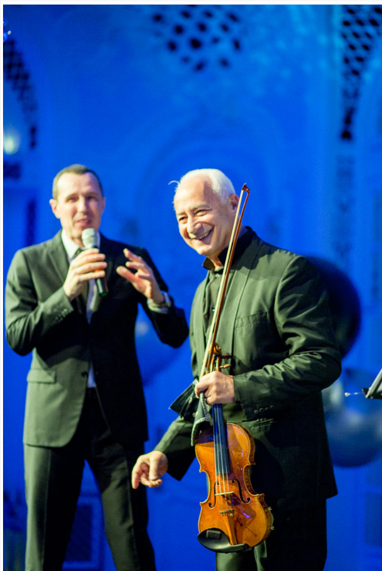
Владимир Спиваков со своей знаменитой скрипкой

Скрипач и дирижер Владимир Спиваков представил публике специальную программу, состоявшую из его любимых произведений: «Сентиментальный вальс» Шуберта, «Венгерский танец соль мажор» Брамса, «О душе человека» Шнитке.