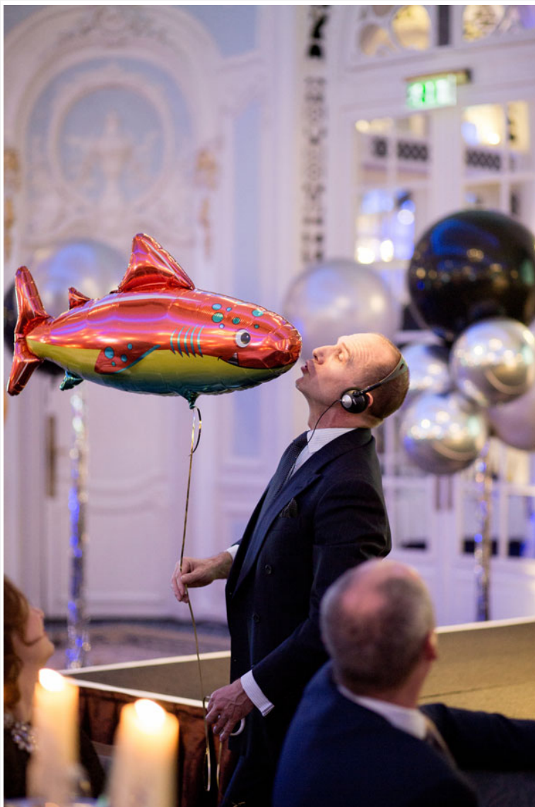
Британский актер Рэйф Файнс