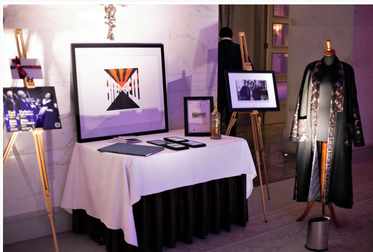
Картина Эрика Булатова «Вперед»