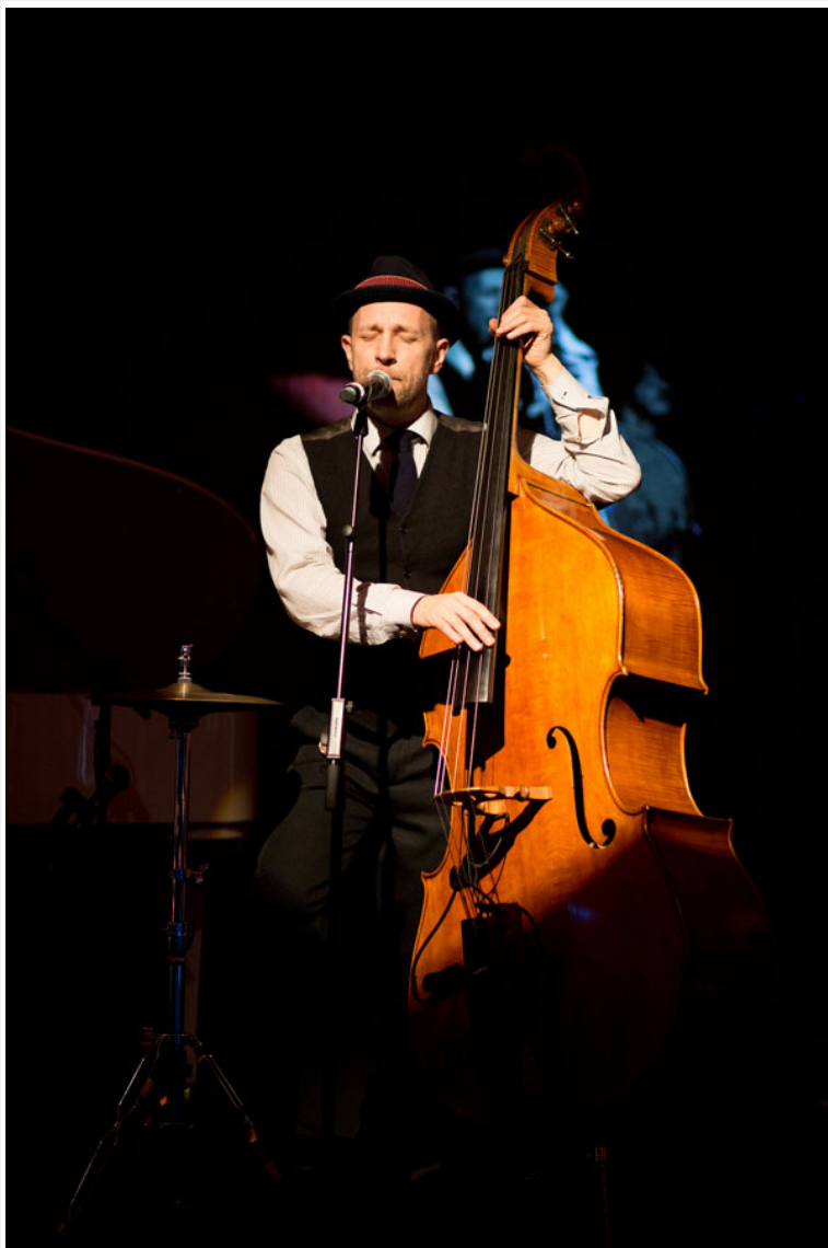
Гости из Санкт-Петербурга джаз-группа Billy's band