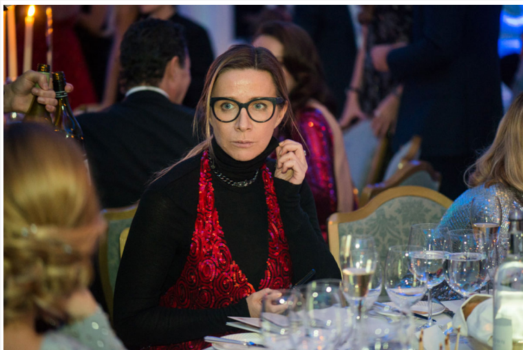
Издатель журнала «Собака.ru», популярный блогер Ника Белоцерковская