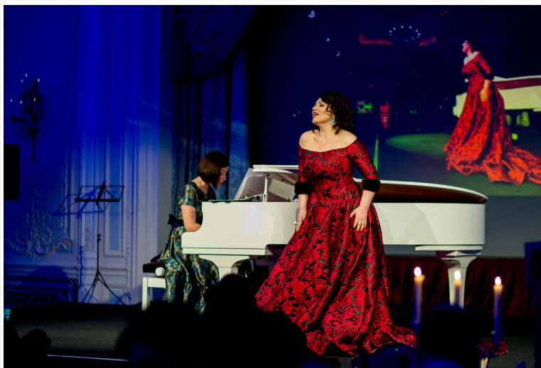
Оперная дива Хибла Герзмава