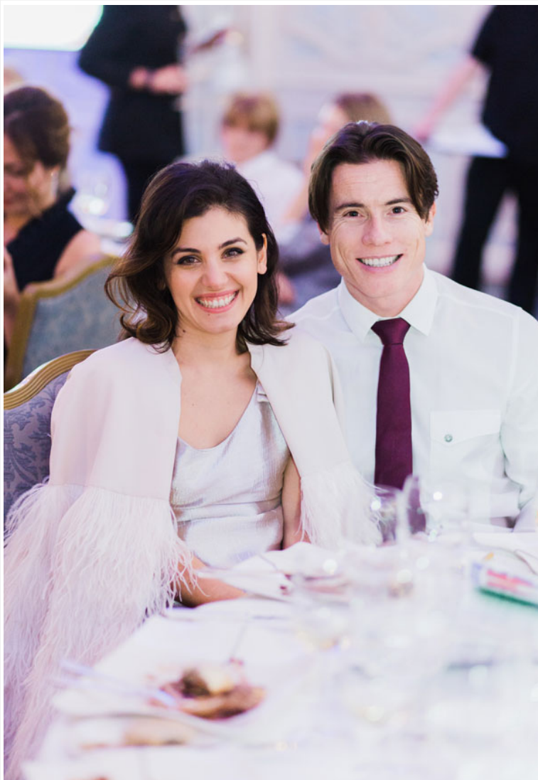
Британская певица Кэти Мелуа со спутником